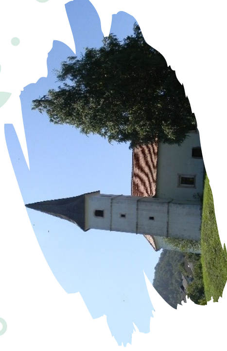
Cerkev sv. Marka na Ostenku

25. aprila bomo obhajali god sv. Marka , zavetnika kmetov, zidarjev, pisarjev, notarjev... V naši župniji stoji njemu posvečena cerkev na Ostenku, kjer so se nekoč obhajale tudi znane »Markove prošnje procesije«. Ob njih so zlasti kmečki ljudje prosili za varstvo pred nevihtami, povodnimi, za lepo vreme in za dobro letino. Tako bom , po teh namenih in s takšno prošnjo Bogu in sv. Marku, na praznično nedeljo sv. bogoslužje obhajal na Ostenku oz. v Jelšju, kakor so ta kraj nekdam imenovali.